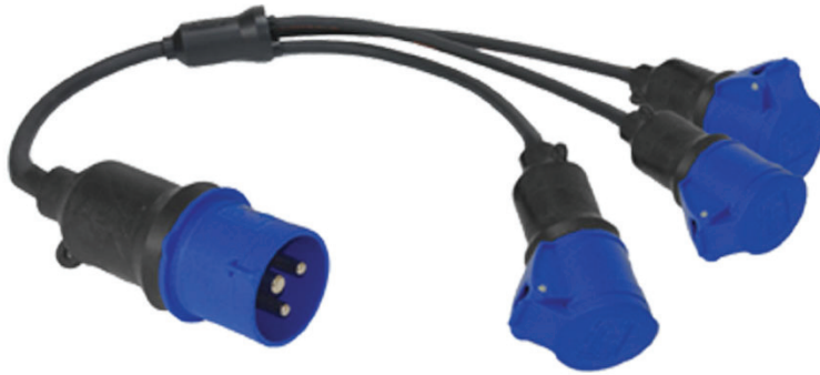
32A - 1ph to 3 x 32A 1ph