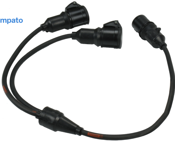
16A CEE Sovrastampato NERO