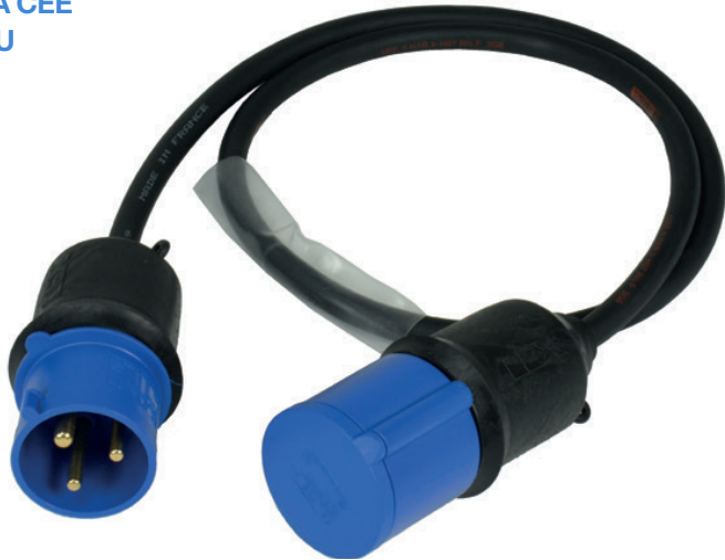
16A CEE BLU